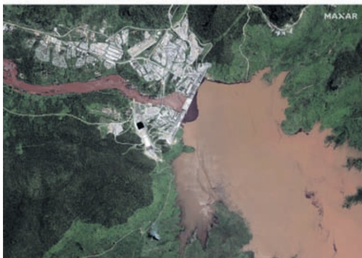
This combination image made from satellite images taken on Friday, June 26, 2020, above, and Sunday, July 12, 2020, below, shows the Grand Ethiopian Renaissance Dam on the Blue Nile river in the Benishangul-Gumuz region of Ethiopia.